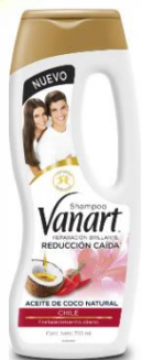
REDUCCION CAIDA ( CHILE )