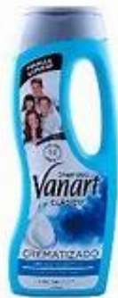
CREMATIZADO (COMPLEJO HUMECTANTE)