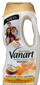
SEDOSO ( MIEL )