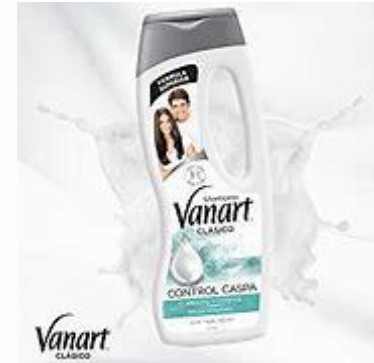
*CONTROL CASPA $33.50 SUGERIDO $39