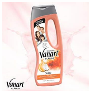
DUO ( LIMPIO Y MANEJABLE )