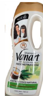
RECONSTRUCCION ( SABILA )