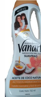
SUAVIDAD (ACTIVOS HIDRATANTES)