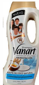
HIDRATACION (LECHE DE AVENA)