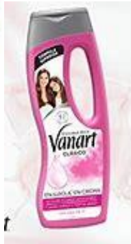
ENJUAGUE EN CREMA (ACONDICIONADORES)